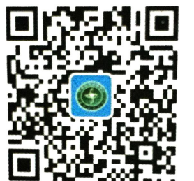
扫码报名 享受优惠